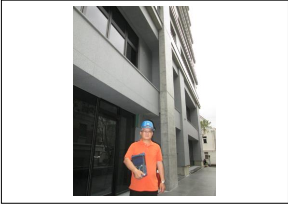
十一. 技術士於建築物前