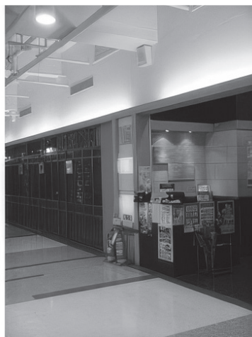
圖-4 商場業務緊急兩用喇叭