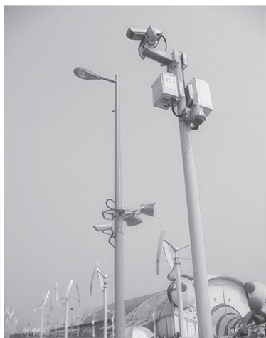
圖-3 CCTV與廣播總是如影隨形

目前各種數位科技發展迅速的今天，緊急廣播系統的應用範圍及需求也更加深入技術應用的地步，提供更符合客戶需求的廣播系統新產品更形重要。目前確實傳統應用的公共廣播系統已經不能滿足現代IP網路科技化的要求和銷售，數字化的公共廣播系統已成為當今廣播系統發展主流，在此之下的系統設計與選型會讓用戶的系統操作更加直觀、更加簡易、系統配置更加靈活、完成功能更加強大。這也是所有從事廣播系統設計工作的工程人員必須及早做好的設計應用與選型功課。