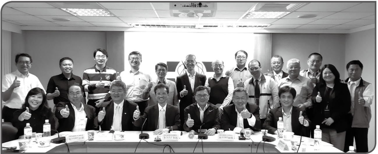
◆電信公會啟動系列高峰論壇，邀請各方專業人士參與

而也因零碎化，廠商會用各種手段，其實最終就是用價格來爭食，結果又導致更多的市場孤兒，因為過度低價化，沒有廠商有能力做後續維護與服務。