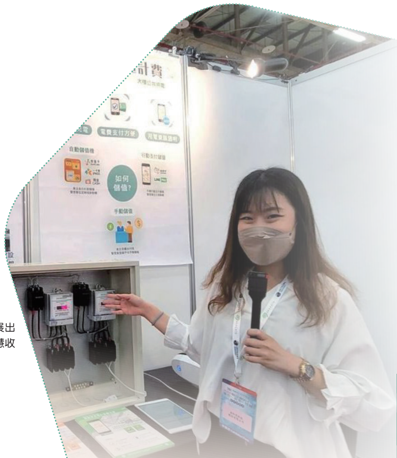
電信公會「2022電信公會5G+AI電信、安全、智慧應用博覽會」展出內容豐富多元，圖為台科電-套房電費收費及電動車充電計費的智慧收費系統。

源、智慧交通、智慧建築、智慧監控等領域的展現更加亮眼，未來博覽會將常態舉辦，讓各界期待資通訊科技帶來的安全與便利。