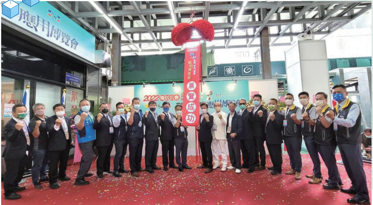
電信公會在台中世貿中心舉辦5G+AI電信、安全、智慧應用博覽會，包括電信公會、台灣電氣公會、台中電腦公會、電器公會、影音協會等貴賓在開幕儀式後合影。

慧建築、智慧監控等技術及設備，就不能錯過「2022電信公會5G+AI電信、安全、智慧應用博覽會」。